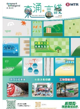
工程通訊 - 《東涌。言綫》