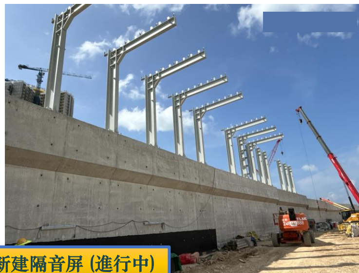
新建隔音屏 (進行中)