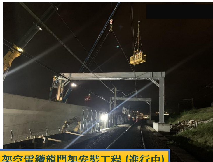
架空電纜龍門架安裝工程 (進行中)