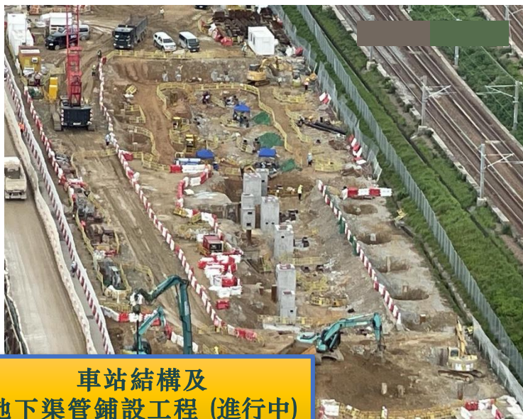
車站結構及 地下渠管鋪設工程 (進行中)