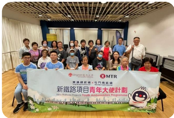
學校及社區講座 - 新鐵路項目青年大使計劃