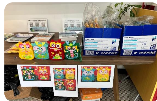
資訊中心派發端午手工包