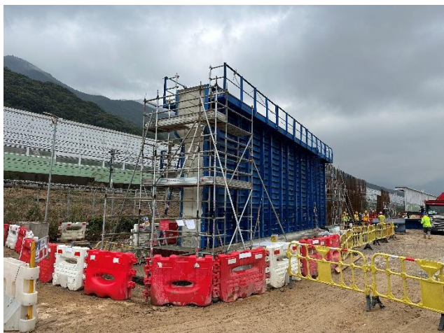
採用可重用金屬板模施工