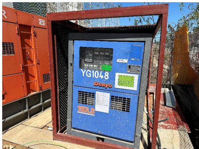
使用優質機動設備