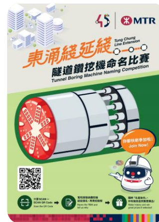
東涌綫延綫 隧道鑽挖機命名比賽