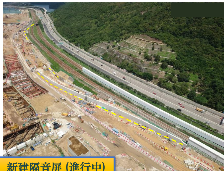
新建隔音屏 (進行中)